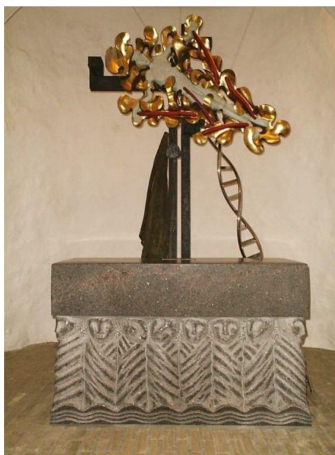
Bjørn Nørgaards alter i Knebel kirke.

Gyldne alter i Sahl Kirke. Den korsfæstede på Jorden i centrum omgivet af de syv himle med paradiset uden for fixstjernehimlen. Guds hånd ses og har det hele i tømme.